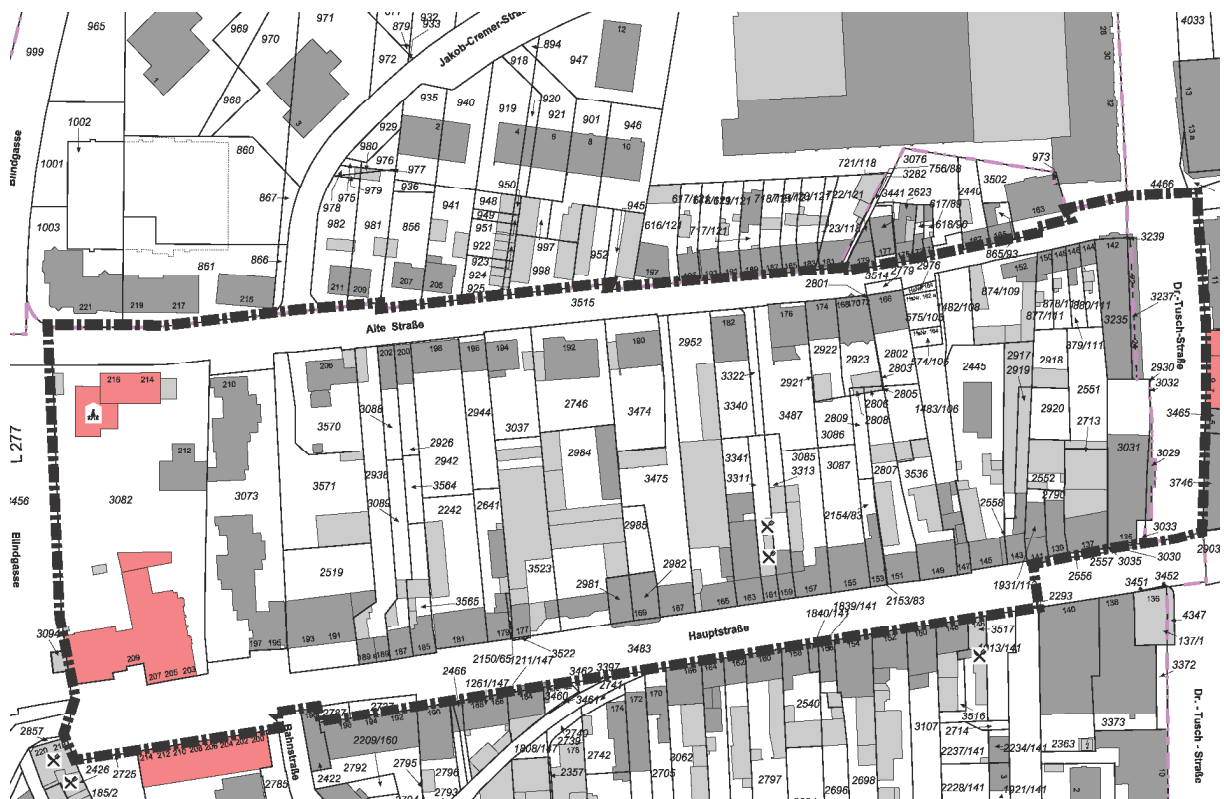
Abb.: Räumlicher Geltungsbereich des Bebauungsplans Nr. 19.43 F „Obere Hauptstraße Nord“

Der räumliche Geltungsbereich des Bebauungsplans befindet sich zwischen Hauptstraße, Dr.-Tusch-Straße, Alte Straße und Blindgasse und ist folgendem Plan zu entnehmen: