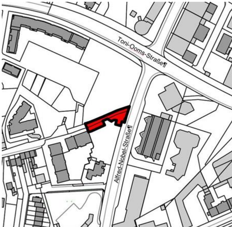
Abb.: Räumlicher Geltungsbereich des Bebauungsplans Nr. 38.1+2 F, 6. Änderung

Der räumliche Geltungsbereich ist folgendem Plan zu entnehmen: